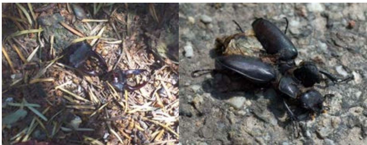
Figuur 3. Twee koppen van mannetjes van het vliegend hert, beide slachtoffer van predatie door vogels.