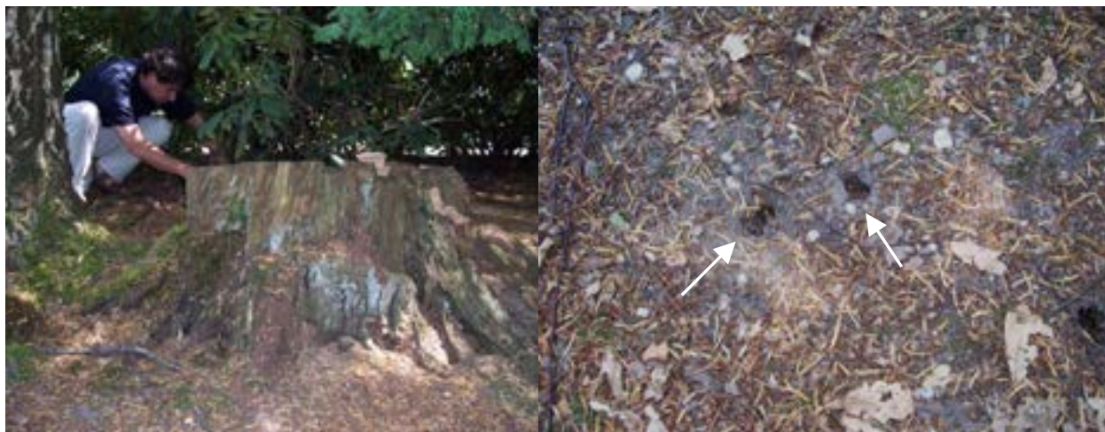
Figuur 1. Eén van de drie oude eikenstronken waar zich een populatie van het vliegend hert in bevindt.