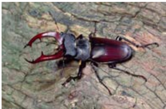
Foto: De mannetjes van het vliegend hert zijn te herkennen aan hun formaat en hun 'gewei'-vormige kaken.