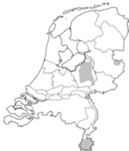
Kaart: Verspreiding van het vliegend hert in Nederland.