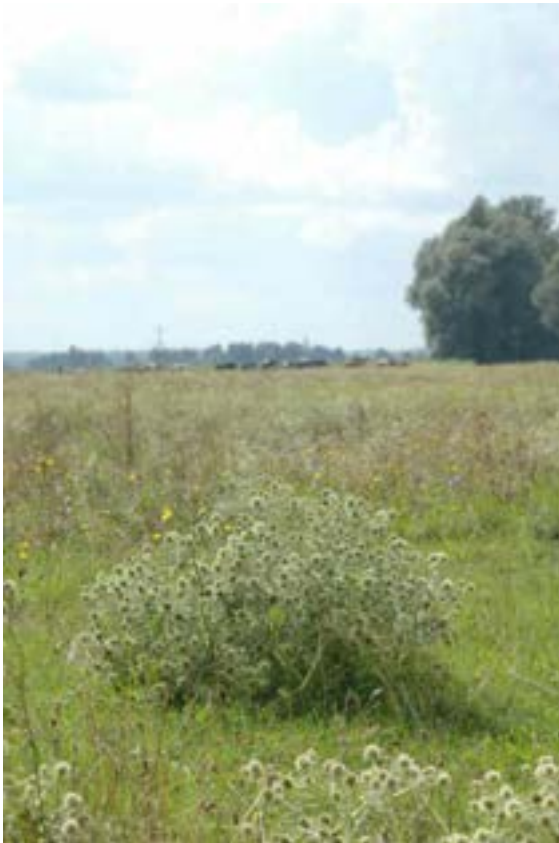
Figuur 12: Kruisdistel op de Kop van de Oude Wiel op 14 augustus 2005. De roodrandzandbij is hier veelvuldig op waargenomen.