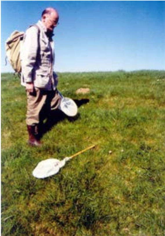
Figuur 5: Nestelplaats op lokatie 2. Het uiteinde van de stok van het net op de grond wijst naar de nestopening (zie figuur 6). Frank van der Meer staat erbij en kijkt ernaar.