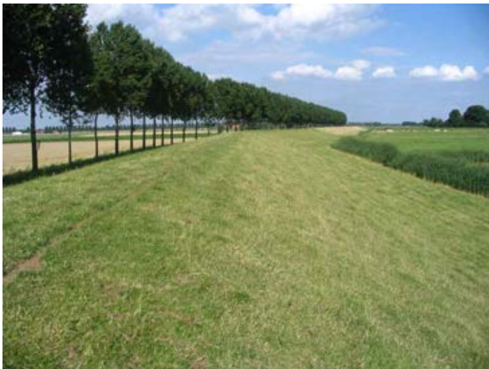
Figuur 4: Dezelfde lokatie als in figuur 3, maar nu op 2 augustus 2004. Op deze dag werd de roodrandzandbij, ondanks onafhankelijk bezoeken door twee waarnemers, hier niet gevonden. Dit was opmerkelijk, omdat er op deze dag op diverse andere lokaties in de omgeving talrijke vrouwtjes op berenklaauw werden gezien, en omdat de soort in het voorjaar wel in aantal nestelend op de ze plek te vinden was.