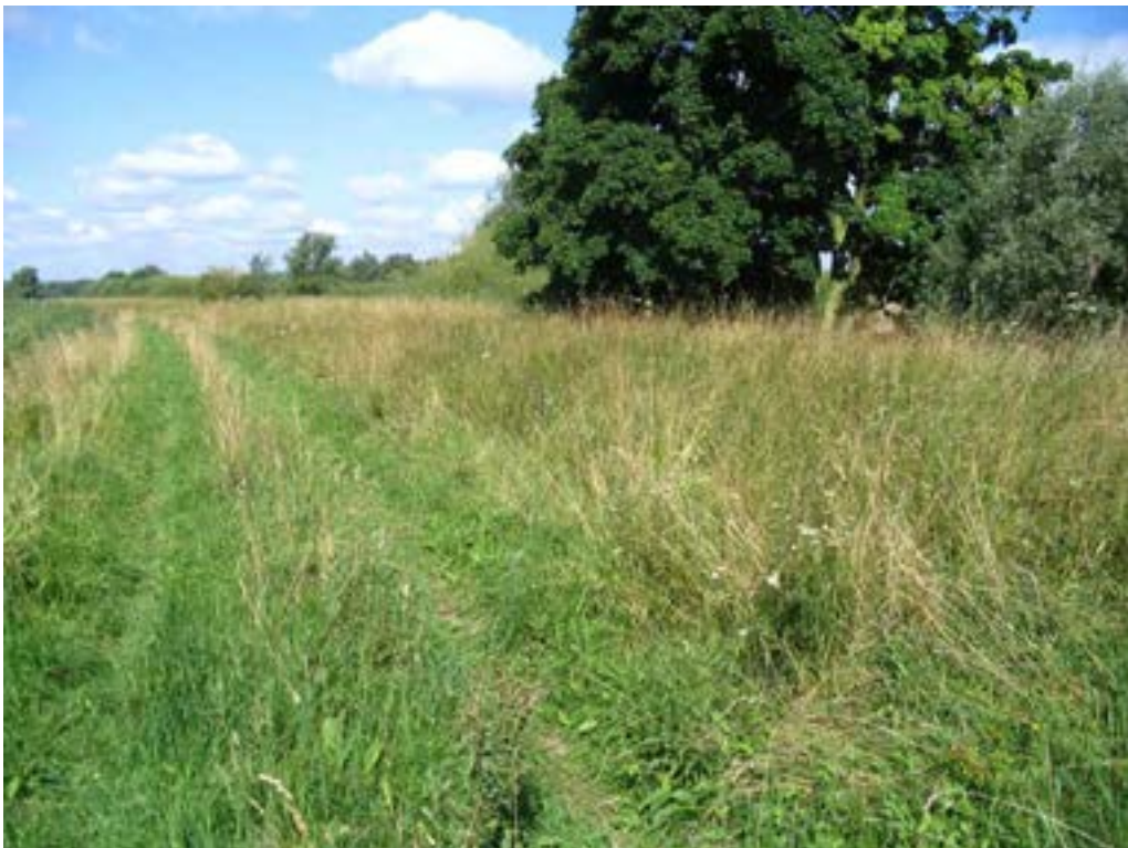
Figuur 11: Dijkje langs de Hengstpolder (lokatie 19). Dit was de enige lokatie waar in de zomer grote aantallen mannetjes gevonden zijn, en waar bovendien diverse mannetjes patrouillevluchten door het gras uitvoerden. Vermoedelijk is dit dus een nestelplaats, al is het ondanks herhaald bezoek niet gelukt om de nesten te vinden.