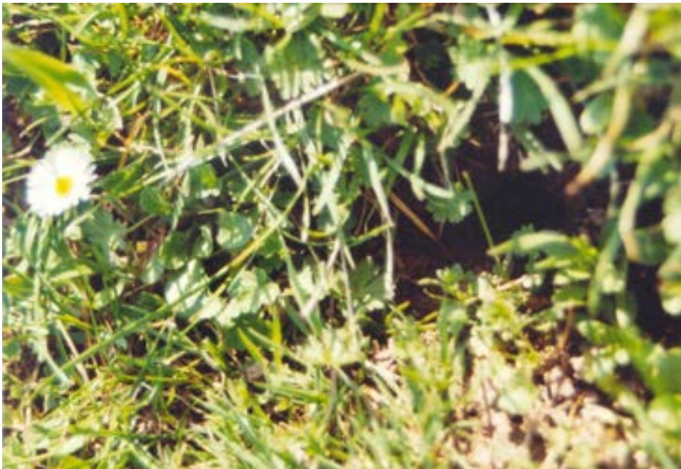
Figuur 6: Close-up van een nestopening op lokatie 2 (zie ook figuur 5). De opening is geheel omringd door gras en kruiden en daardoor moeilijk te vinden.