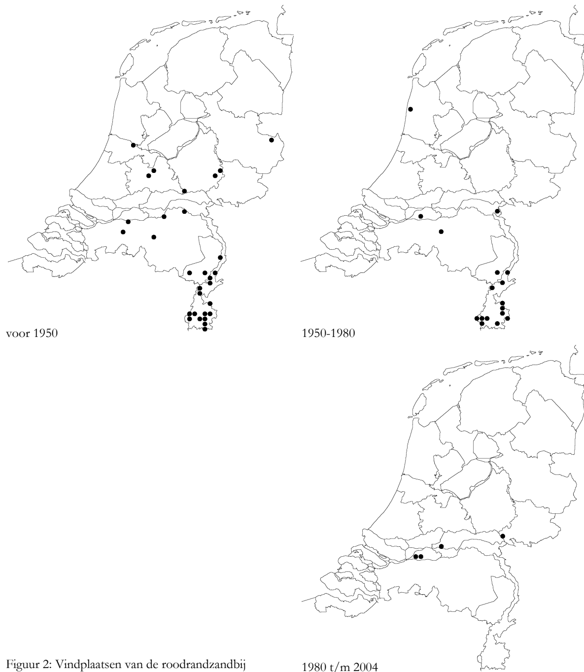
Figuur 2: Vindplaatsen van de roodrandzandbij Andrena rosae in Nederland in drie perioden.