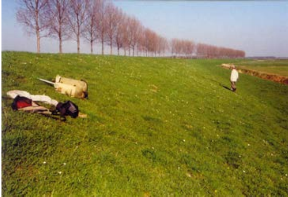
Figuur 3: De Zuiddijk langs de Tongplaat (lokatie 7) op 2 april 2005. Op deze dag werden hier enkele patrouillerende mannetjes en diverse nestelende vrouwtjes waargenomen, die met stuifmeel kwamen aanvliegen. De dichtstbijzijnde wilgen waren enkele honderden meters ver.