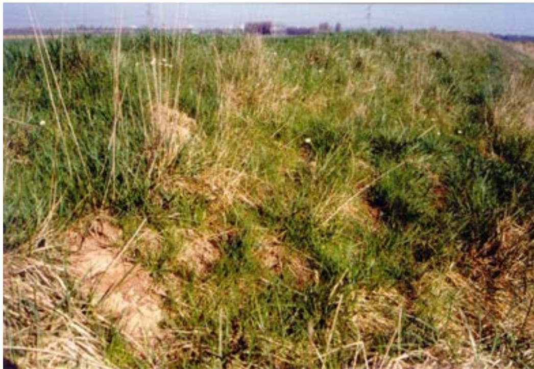
Figuur 8: Op de top van de dijken, zoals hier op lokatie 2, is vaak kale bodem aanwezig. Hier nestelt de roodrandzandbij niet. Wel nestelen er diverse andere soorten bijen.