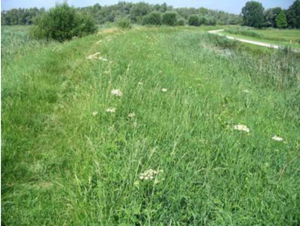
Figuur 10: Dijk ten zuiden van de Zuilespolder (lokatie 19), waar op 14 juli 2004 circa 40 foeragerende vrouwtjes van de roodrandzandbij op berenklaauw zijn waargenomen. Op dergelijke plekken in de Zuid-Hollandse Biesbosch, waar vele berenklaauwen bloeien, is de soort 's zomers doorgaans in aantal te vinden.