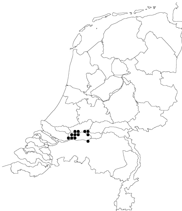
Figuur 13: Vindplaatsen van Andrena rosae in Nederland in 2005 (op basis van 5x5-kmhokken). De vier meest oostelijke stippen liggen buiten de Biesbosch.

In de zomer van 2005 vonden enkele waarnemers onafhankelijk van elkaar exemplaren van Andrena rosae buiten de Biesbosch, op enkele plaatsen in het westelijke rivierengebied (figuur 13). Dit is opmerkelijk, omdat recente vondten vrijwel alleen uit de Biesbosch bekend waren. Of hier sprake is van populaties die over het hoofd zijn gezien of van een oostwaartse uitbreiding vanuit de Biesbosch is niet duidelijk. Het is de moeite waard om de komende jaren goed op te letten in andere delen van het rivierengebied.