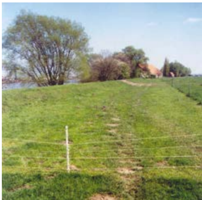
Figuur 9: De nestelplek op locatie 18 betreft een veel lager dijkje dan de overige nestelplaatsen. Hier werd slechts één nestelend vrouwtje gevonden, dus mogelijk zijn deze lage dijkjes minder geschikt.