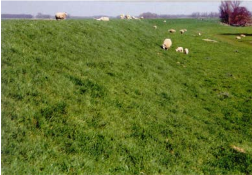
Figuur 7: Op sommige nestelplaatsen wordt de dijk door schapen begraasd (hier lokatie 5).