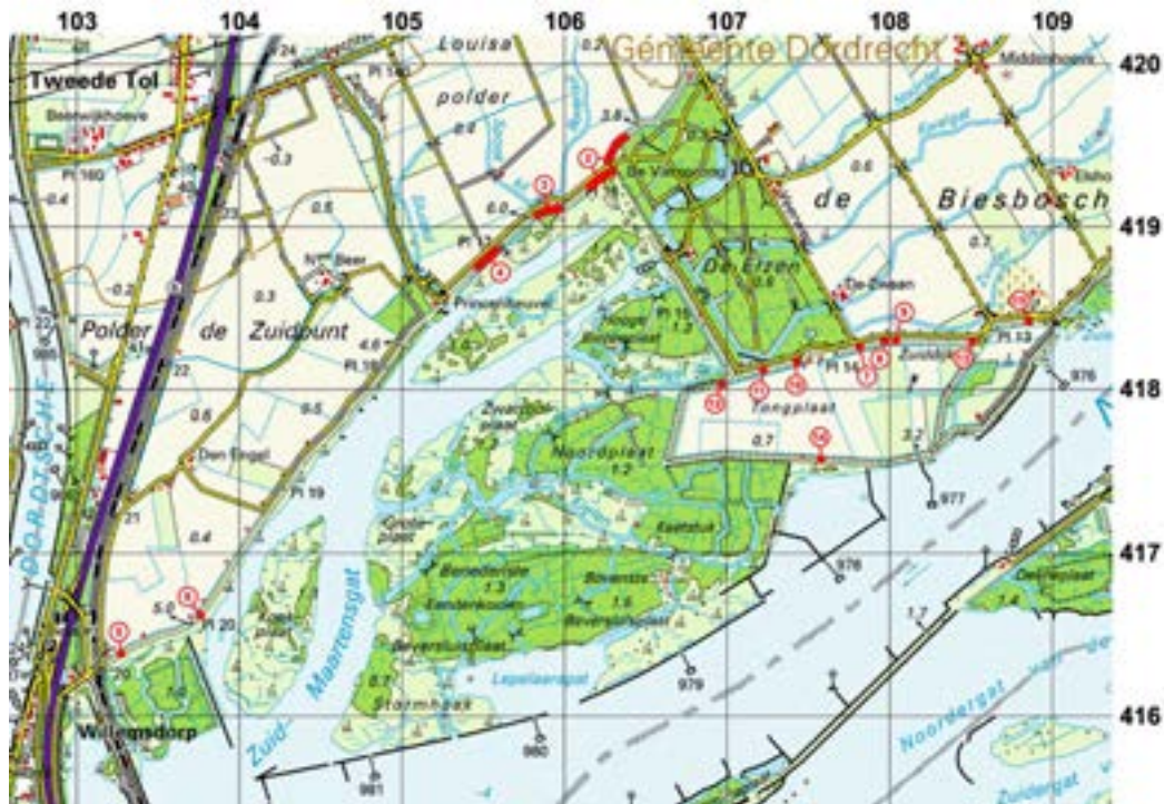
Westelijk deel van de Zuid-Hollandse Biesbosch ('Dordtse Biesbosch').

De nummers van de nestelplaatsen komen overeen met de nummers in bijlage 1. Het randschrift van de figuren geeft coördinaten weer in het Amersfoort-stelsel.