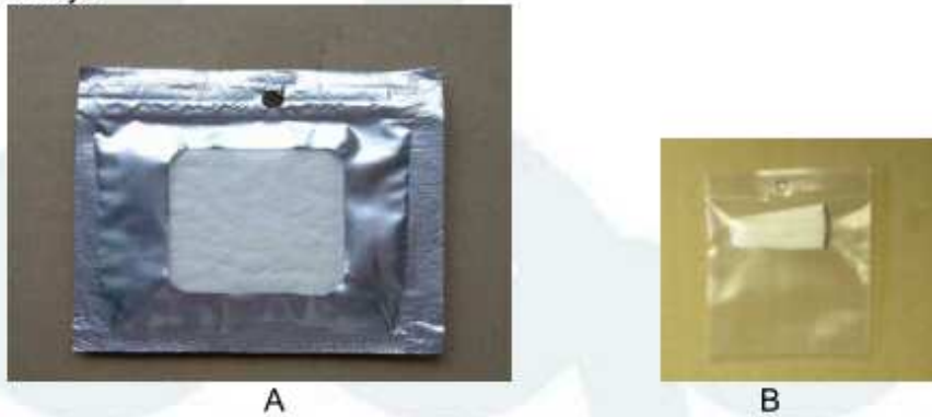
Figuur 3. Ipsowit.

GALLOPROTECT 2D , Comprising two diffusers with Kairomonal attractants(A) and pheromones (B). They last 45 days